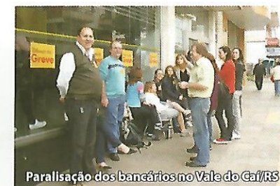
Paralisação dos bancários no Vale do Caí/RS