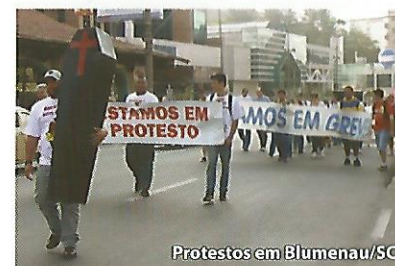
Protestos em Blumenau/SC

Os bancários se multiplicaram aos milhares espalhados nas lotéricas, mercados e lojas, ao mesmo tempo em que diminuíram nos bancos. Os que estão fora das agências bancárias sofrem com trabalho ainda mais precário. Os bancários que estão nas agências são pressionados para atingir metas de vendas, atender cada vez mais gente e mais rápido e assim as lesões nos braços, mãos e coluna aumentam na mesma intensidade que a dor mental, pois a pressão tem levado um numero cada vez maior de bancários à depressão e até mesmo ao suicídio.